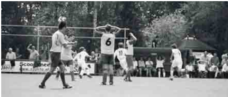
Blijdschap bij RKZVC, ongeloof bij Sportclub Brummen

Eerder tijdens deze seizoensafsluiting van de selectie is het afgelopen seizoen nog vaak ter sprake gekomen. Het is een bewogen seizoen geweest. Niet alleen voor de selectie maar voor de hele vereniging een seizoen met de nodige dieptepunten. Op het sportieve vlak ligt de dramatisch verlopen nacompetitie nog vers in het geheugen. Na een sterke comeback tegen Angerlo Vooruit duurt het finaleduel tegen RKZVC uit Zieuwent een paar minuten te lang. In de slotminuten slaagt RKZVC erin om een 2-1 achterstand om te buigen in een 3-2 overwinning. Een gevoelige klap voor Sportclub Brummen. Onze club is immers jarenlang een stabiele derdeklasser geweest.