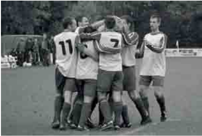
Blijdschap na een gescoord doelpunt

Eind juli komt de selectie weer bijeen voor de eerste trainingen. Sommige spelers zijn dan al op vakantie geweest, anderen zullen nog met vakantie gaan. Daarom wordt er in de voorbereiding in veel verschillende opstellingen gespeeld, met wisselende resultaten tot gevolg. Goede wedstrijden worden afgewisseld met matige. Het seizoen wordt gestart tegen een oude bekende: Angerlo Vooruit. Vorig seizoen hebben we aangetoond dat als we goed spelen van deze ploeg moeten kunnen winnen. Na een ongelukkig begin spelen we vooral de tweede helft erg sterk en winnen we, hoewel de doelpunten in de slotfase vallen, verdiend. Een week later worden we door RKPSC van onze roze wolk getrokken en staan we weer met beide beentjes op de grond. In een matige wedstrijd verliezen we met maar liefst 4-0. In de weken erna is het spel van wisselend niveau maar de drie punten worden bijna iedere week gehaald.