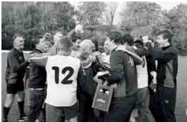
Explosie van vreugde na het behalen van de periode

in de tweede helft heerst de thuisploeg en wint na een ruststand van 1-0 dikverdiend met 3-0. De 1e periode is overtuigend binnengehaald. Een prima prestatie die boven de verwachting van velen is. Na de degradatie en het stoppen van bepaalde spelers aan het eind van vorig seizoen is dit voor veel betrokkenen binnen de club een onverwacht snel succes. Maar om de woorden van trainer Ronald Dekker te gebruiken: hoe dit seizoen ook verder zal verlopen, aangetoond is dat we een goede ploeg hebben voor de 4e klasse.